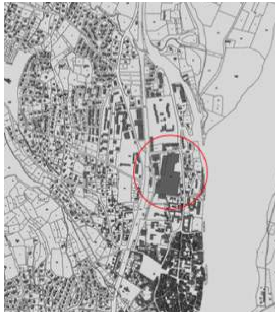
Un site d'ampleur, situé en entrée de ville