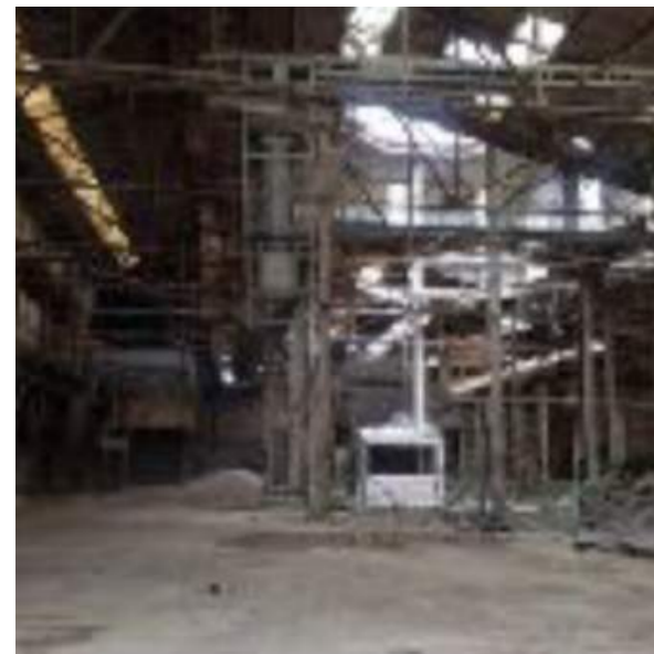
L'intérieur du site

Montant de mission : Phase 1 : 27 500 € HT Phase 2 : en cours de négociation