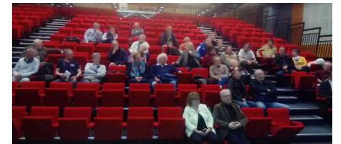
La réunion publique