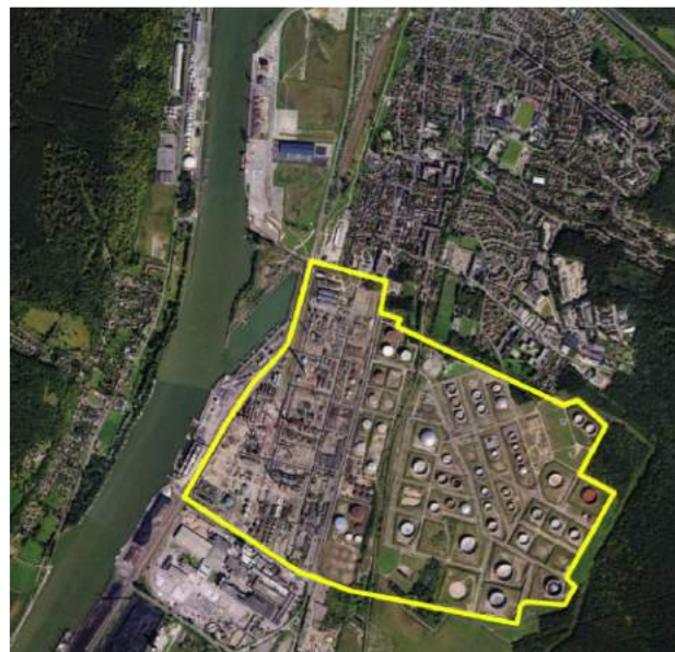
Vue aérienne de la friche Pétroplus