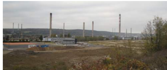
Une friche industrielle de grande ampleur...