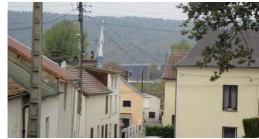
...qui jouxte les secteurs à vocation d'habitat