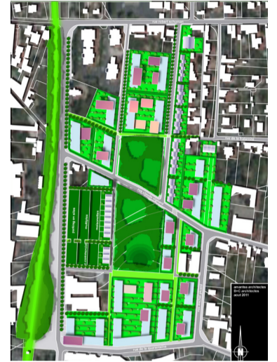
Plan masse de l'écoquartier

Prestations assurées par Condition Urbaine :