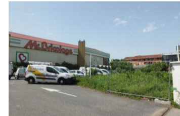
Friche Mr. Bricolage

Avancement : opération livrée en 2016 et 2018 (deux tranches)