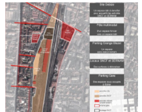
Mutation préalable des usages